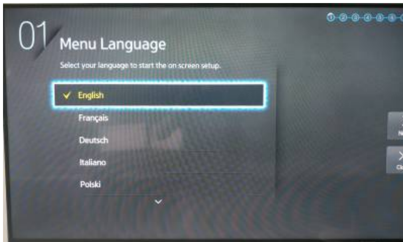
Étape 1 : Choisissez votre langue

Ce guide vous permettra d'effectuer la configuration initiale d'un écran SSSP. Vous pouvez réaliser ces étapes après une réinitialisation d'usine.